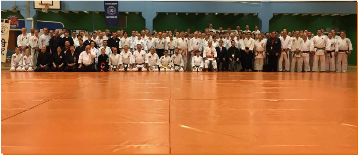
Photo de l'ouverture officielle du stage européen Kokusai Budoin IMAF, Copenhague 2015. Deux-cents budoka de toutes les disciplines de la Fédération s'étaient réunis

Nous remercions Jean Baptiste BUDJEIA pour la réalisation de ce compte rendu.