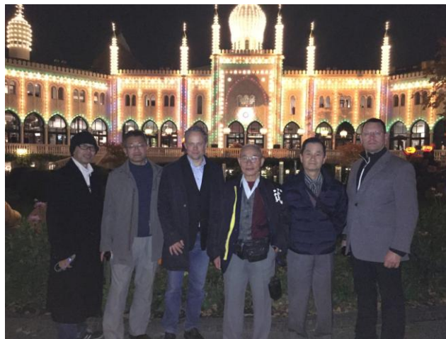
La délégation japonaise devant le Tivoli Garden, dans le Centre de Copenhague.